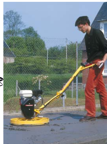
BG 49 GS